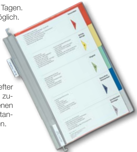
Typ 3, Best.-Nr. 9209-00769

Der Personal-Transparenz-Hefter Typ 3 kann zur Aufbewahrung zu- sätzlich mit Metallhängeschiene ausgestattet oder direkt in Stan- dard-Ordner eingehängt werden.